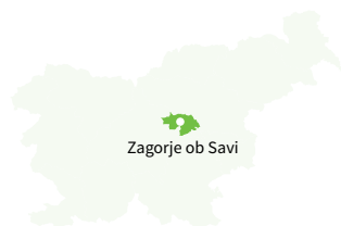
Zagorje ob Savi